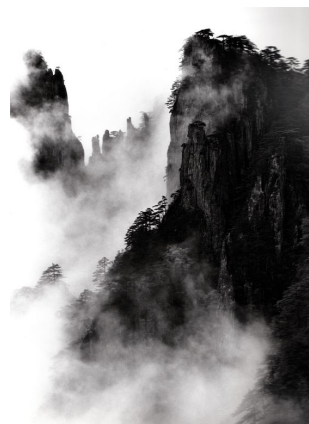
Technique chinoise du Sumi-e