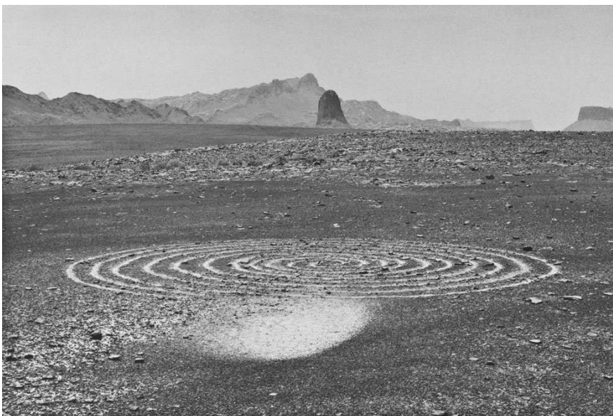
Whirlwind spiral - The Sahara – 1988 – Richard Long

http://www.youtube.com/watch?feature=player_detailpage&v=O9TyHzP-8b8