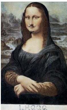
Marcel Duchamp L.H.O.O.Q. 1919; 19.7 x 12.4 cm

Pendant la première séance, dans le premier quart d'heure, les élèves sont incités à expérimenter des techniques avec la gomme et leurs mains afin de transformer partiellement l'image qu'ils ont choisie. Ce quart d'heure sera suivi par une seconde mission, la mission B est ensuite donnée: « Reconstituer un autre visage à partir des « restes » du visage effacé, en utilisant le dessin, la peinture, le collage. L'incitation sera donnée comme ceci: "A partir de votre production sur le thème de l'effacement partiel, et en utilisant le dessin et/ou le collage, vous reconstituez un visage nouveau et unique". Après avoir dévoilé le sujet, un temps de verbalisation, d'environ dix minutes, est fait par le professeur pour enrichir la culture artistique des élèves dans le but de leur donner diverses pistes pour appréhender la mission B: