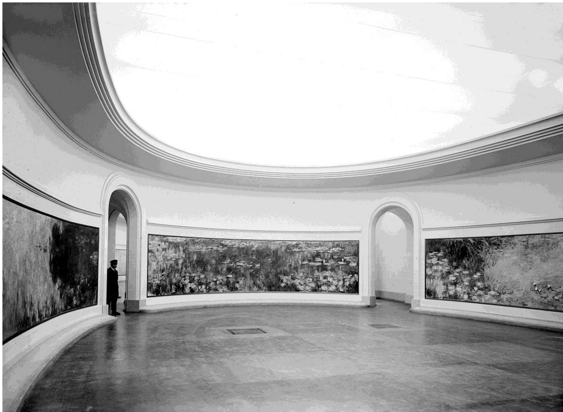
Document 2 Claude Monet