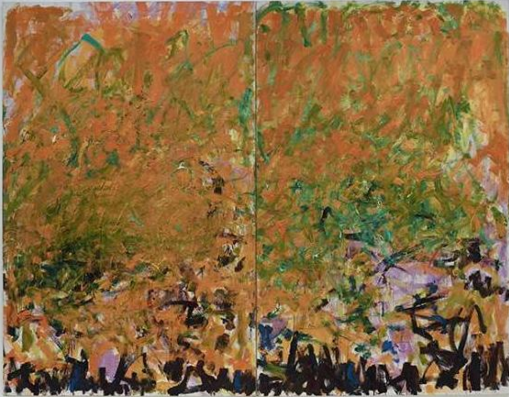
Document 3 : Joan Mitchell