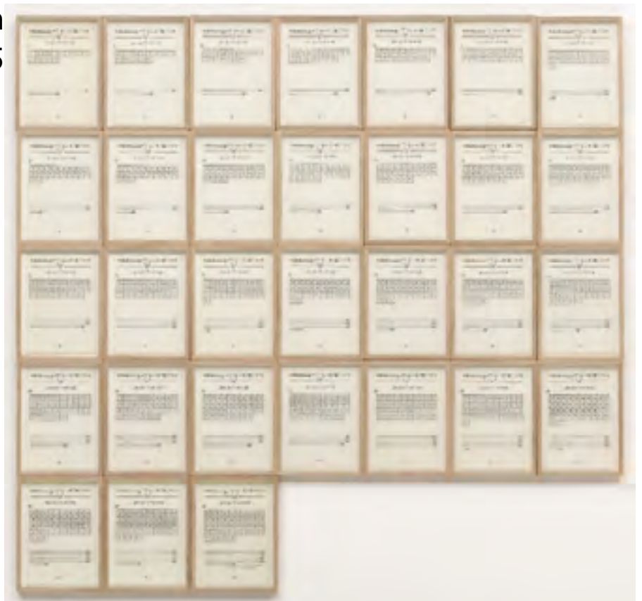
Hanne Darboven Month III, 1975