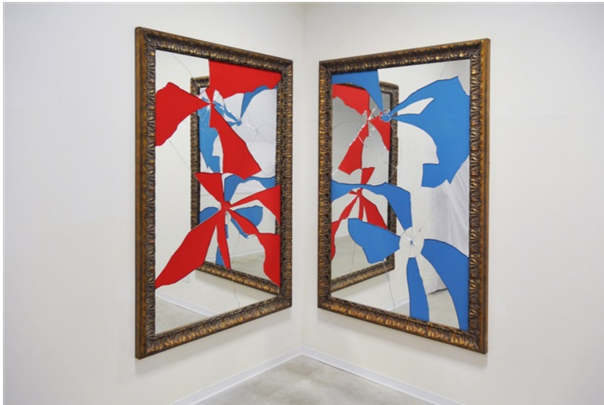
Two Less One Colored, 2015 Installation, Mirror, gilded wood 180 x 120 cm

En tension avec les oeuvres de Soulages, Pistoletto éclate l'espace pour en ouvrir le champ de possibles, tel un kaléidoscope