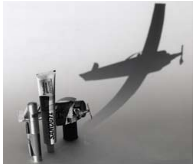
Colette HYVRARD , Série Petits Bolides , 1993