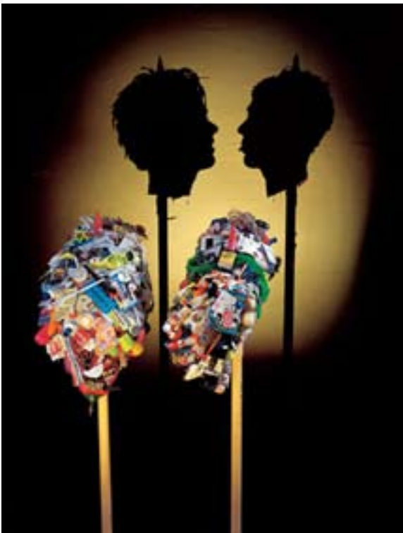
NOBLE Tim et WEBSTER Sue

En fonction des lieux dans lesquels il est dressé, s'anime selon une configuration à chaque fois renouvelée