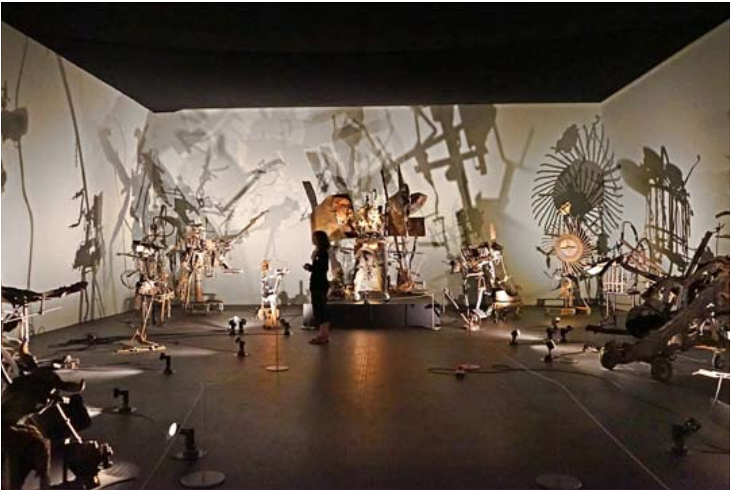
Jean TINGUELY , Dance Macabre , 1986

Musée Tinguely, Bâle, Donation Niki de Saint Phalle