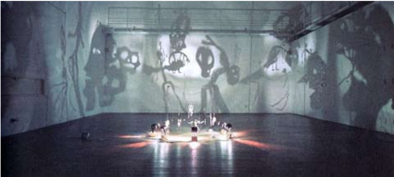
Christian BOLTANSKI, Théâtre d'Ombres

De 1984, 1997 au Musée d'Art moderne de la ville de Paris